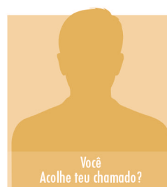
Você Acolhe teu chamado?