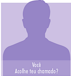
Você Acolhe teu chamado?