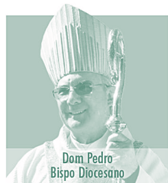
Dom Pedro Bispo Diocesano